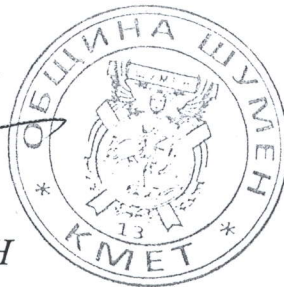
ЛЮБОМИР ХРИСТОВ КМЕТ НА ОБЩИНА ШУМЕН